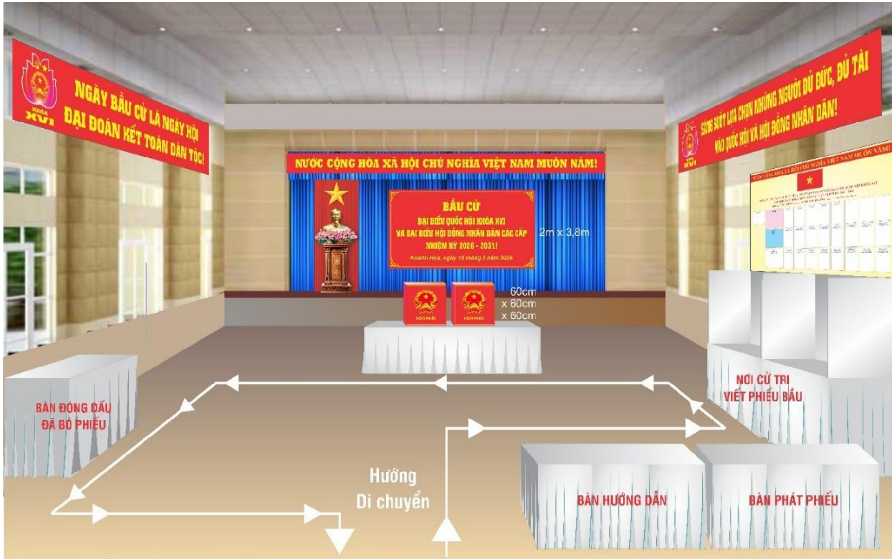
Phối cảnh Phòng bỏ phiếu.